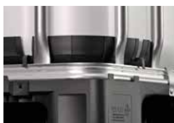
Cornières de protection