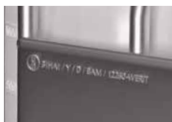
Marquage UN UN 31 HA1/Y/D/BAM