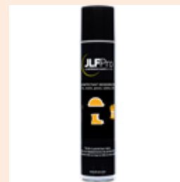
V322069-DD DESINFECTANT DESODORISANT